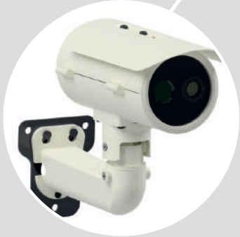
Fire Multi Detector